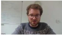
F. Zuber – DGP/SCHAPI Vigicrues