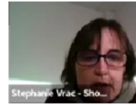
S. Vrac – SHOM Mutualisation infra