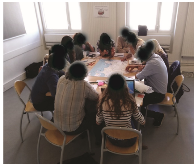
Table de jeu

Mise en évidence des zones prioritaires d'action et des conflits potentiels